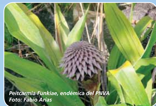
Peitcarmia Funkiae, endémica del PNVA