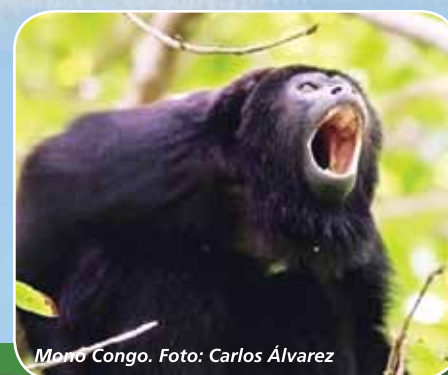
Momo Congo.

The public area of the Arenal Volcano National Park is 10 miles (16 km) northeast of downtown La Fortuna, San Carlos and is accessible by all types of vehicles along a 9 mile (14 km) paved road and 1.2 mile (2 km) gravel road in good condition with signs leading you to the final destination.